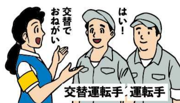
交替運転者の配置